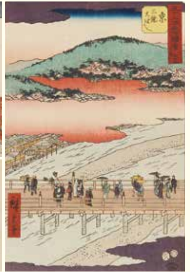
左上/「東都名所 浅草金龍山年之市」 左下/「東海道五拾三次之内 日本橋」 右/「五十三次名所図会 京 三條大はし」 ▲広重美術館