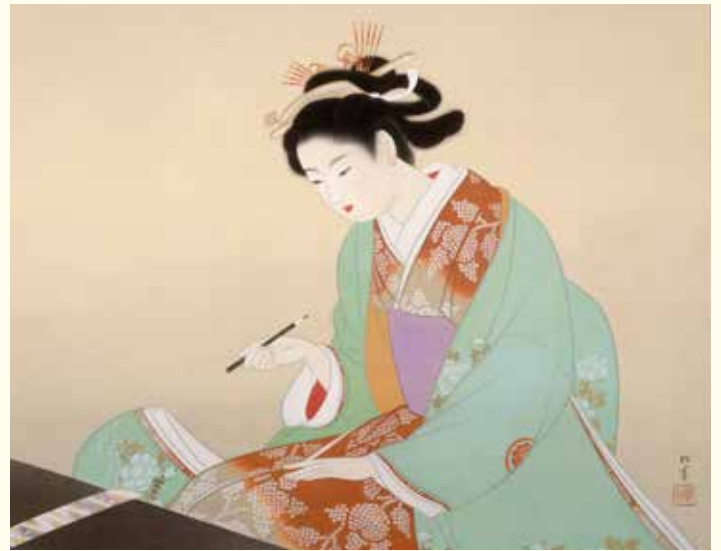
上村松園「美人詠哥」 ▲天童市美術館