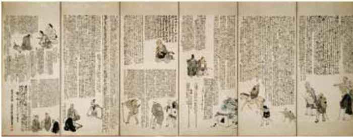
上/横山華山「紅花屏風」(右隻) 山形県指定有形文化財 下/与謝蕪村「奥の細道図屏風」 重要文化財 ▲山形美術館