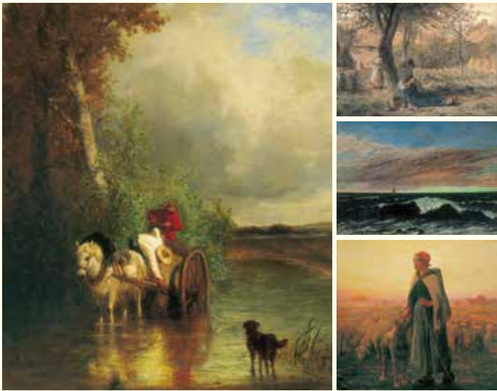
左/コンスタン・トロワイヨン「小川で働く人々」 右上/ジャン＝フランソワ・ミレー「庭にて」 右中/ギュスターヴ・クールベ「波」 右下/エメ・ペレ「羊飼いの少女」 ▲山寺後藤美術館